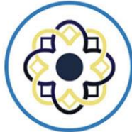
سازمان متخصصین و مدیران ایران