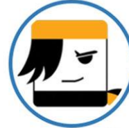
شرکت مسافرتی علی بابا