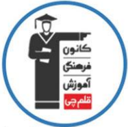
کانون فرهنگی آموزش (قلمچی)