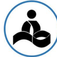
مدارس علامه طباطبائی